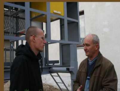
Most már ő adja át a tudását a „Zöldfülűeknek”